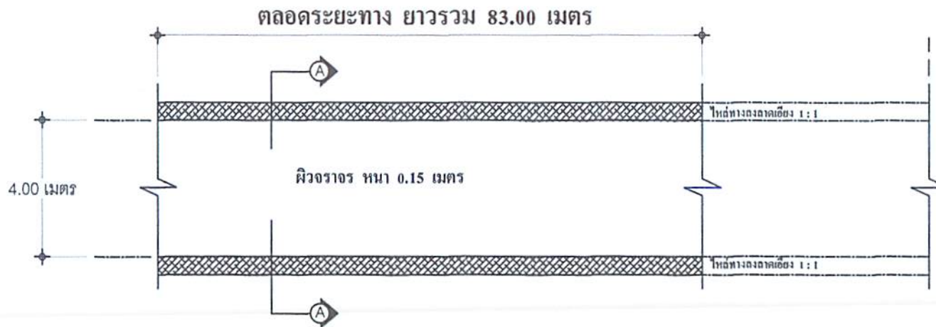
แปลน งานก่อสร้างถนนคอนกรีตเสริมเหล็ก มาตราส่วน 1 : 100