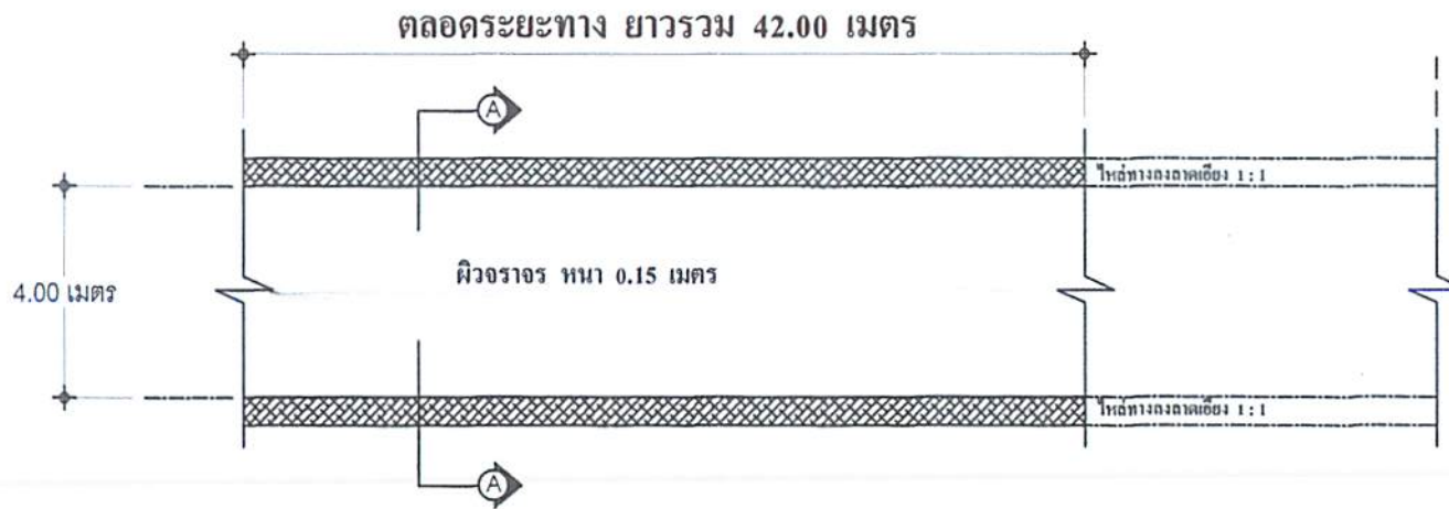
แปลน งานก่อสร้างถนนคอนกรีตเสริมเหล็ก มาตราส่วน 1 : 100